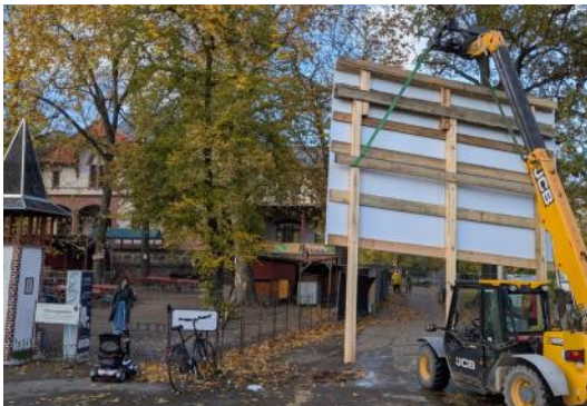
Oktober: das Bauschild zur großen Innen-sanierung kommt angefahren.