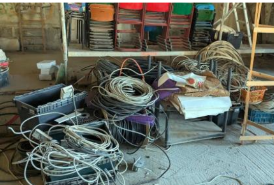
März: wir beginnen mit dem Ausräumen des Hauses. Was entsorgen, behalten, verschenken?