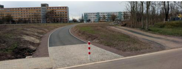
Neue Wege zum Gimritzer Damm (oben) und zum Verkehrsgarten (unten).