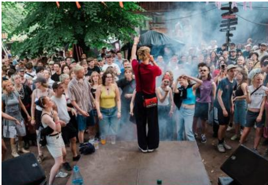
Juli: das zweite Sommerfest - wieder ausverkauft und jetzt schon legendär!