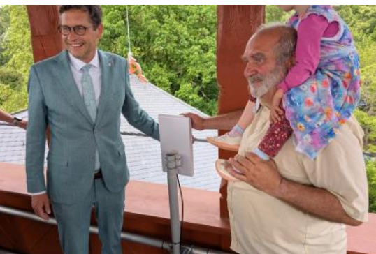
Juni: das Freifunk-Netz auf der Insel wird eingeweiht. Mit auf dem Turm der OB.