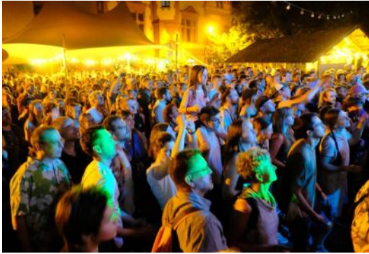
21. Juni: Fête de la Musique und La Confiserie aus Paris spielt vor vollem Haus!