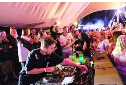
1. Mai: wir eröffnen die Tanzsaison mit Super Flu an der Kastanie.