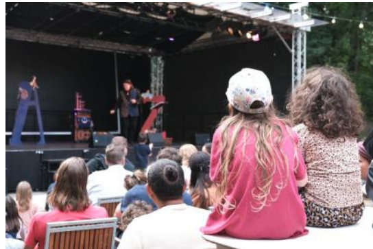
August: auch zum zweiten Mal zu Gast beim Kinderliedersommer: Gerhard Schöne!