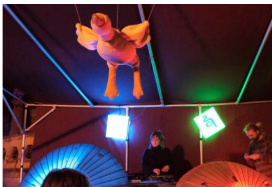
Mai: die zweite Saison MiWoPhause startet mit dem Daune-Kollektiv.