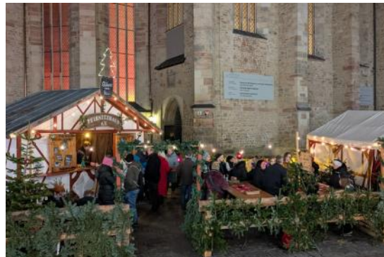
Dezember: wir beim Weihnachtsmarkt vor einer frisch sanierten Ulrichskirche.