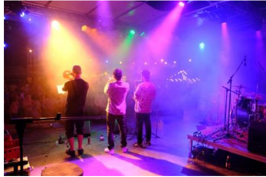
Juli: zwei mexikanische Bands lassen uns ausgelassen auf dem Sand vor der Waldbühne tanzen.