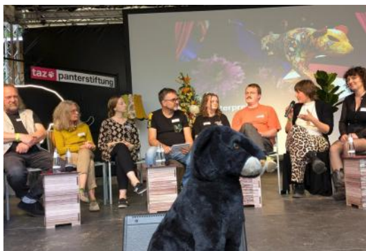
Juni: die Taz-Panther Stiftung feiert einen Tag lang ihre Preisvergabe am Peißnitzhaus.